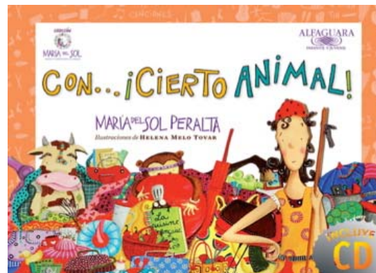
Con... ¡cierto animal!

Éste año Tomatina Curatodo hará parte de la colección.